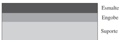
Figura 1. Camadas dos revestimentos cerâmicos.

O defeito conhecido como "Pin Holes", são imperfeições na superfície de um corpo cerâmico, sua aparência é semelhante à cabeça de um alfinete. Pode ocorrer por